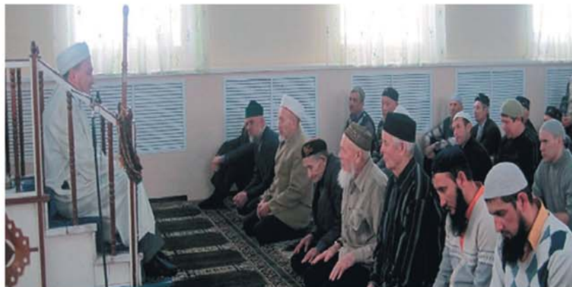
г.Канаш (Чувашская Республика). Маулид: вагаз проводит и.о. председателя РДУМ ЧР, муфтий Наиль-хазрат Галяутдинов