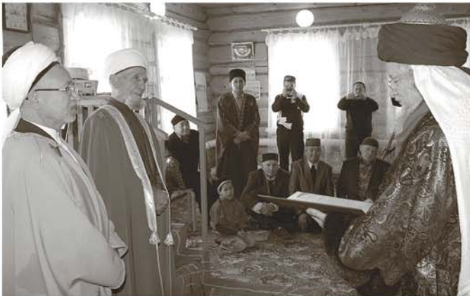
Шейхуль-ислам поздравил юбиляра и подарил ему Коран

1975 елда Башкиравтодор карары белән бер елга Ленинград шәһәренә күпер төзү өйрәнү өчен укырга жиберәләр. Укуны яхшы уңышлар белән, котлау грамоталары белән тәмамлай.