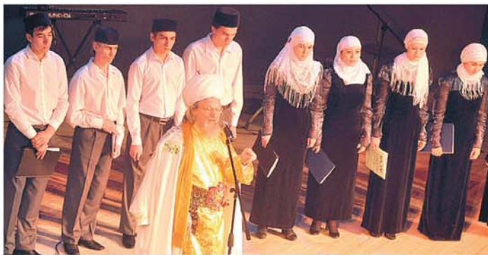
Башкирский драмтеатр, г.Уфа. Маулид.