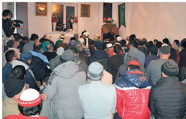
Микрорайон "Затон", г.Уфа