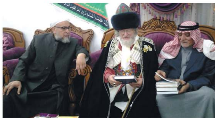
У шейха Абдур-Раззак ас Са'ди, потомка Пророка Мухаммада с.г.в.