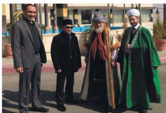
Члены делегации ЦДУМ России