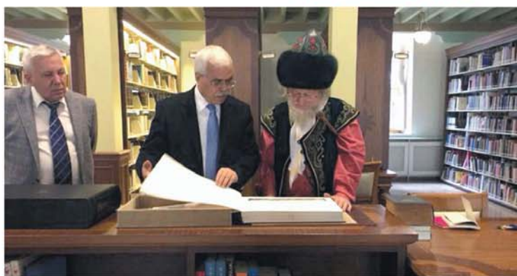
Стамбул, посещение штаб-квартиры «ИСЕСКО»

Уважаемые читатели! Отнеситесь с почтением к газете, не используйте ее в недостойных целях,