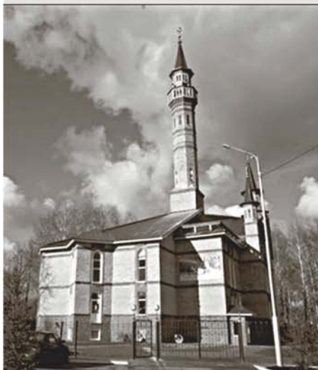
Мечеть в Деме